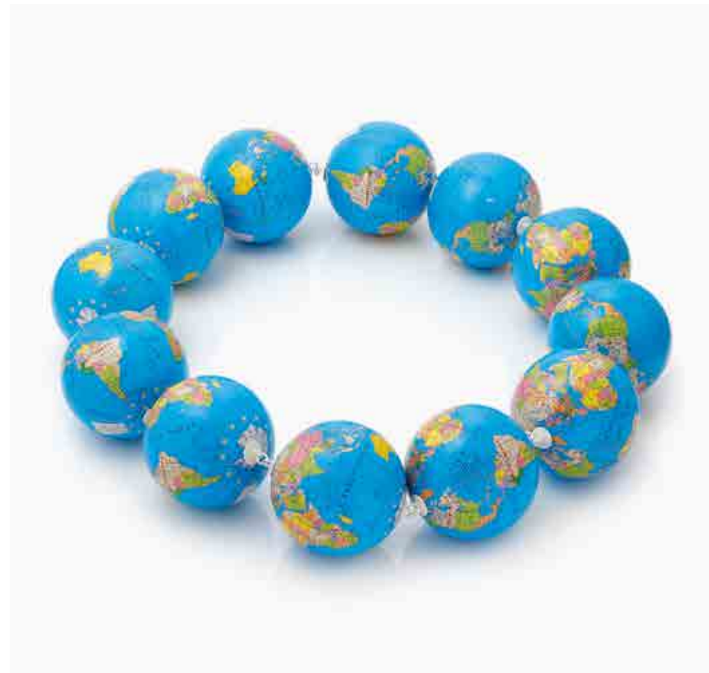
Globalne ocieplenie naszyjnik, mosiądz, lakier proszkowy, plastikowe kule, 2022