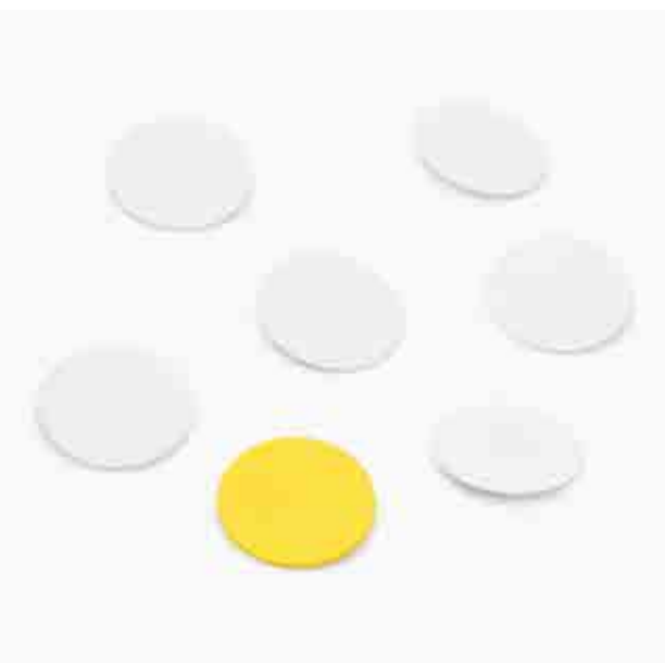
There is something in there necklace, silver, Traffolyte, 2022