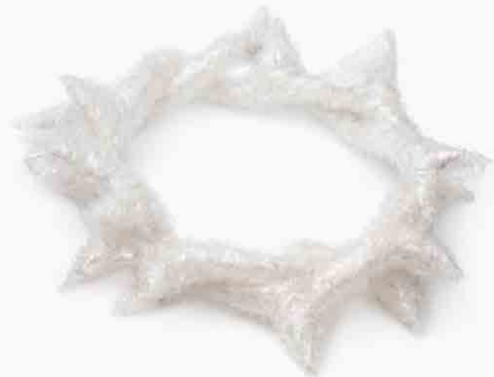
Owinięta diamentowa korona cierniowa Kendricka Lamara korona, folia bąbelkowa, złoto, diamenty, 2022