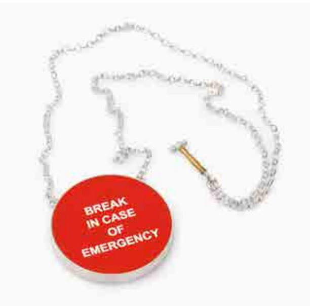
Tam coś jest naszyjnik, srebro, traffolyt, 2022