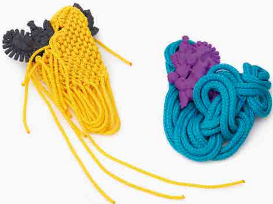
Chronić przed ujawnieniem #IV brosza, lina, poliamid, srebro, posrebrzana stal nierdzewna, 2022