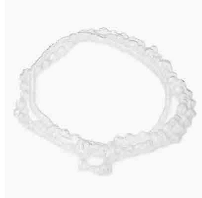
Bqbelki naszyjniki, plastik, 2022